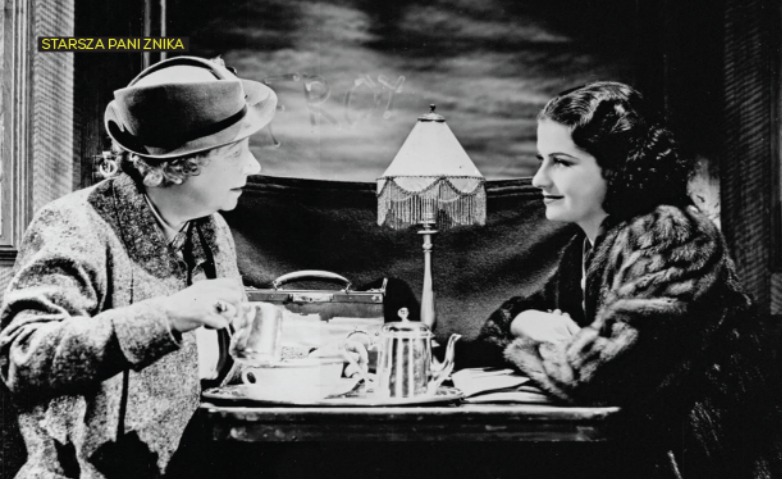
STARSZA PANI ZNIKA