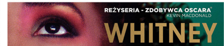
WHITNEY, reż. Kevin Macdonald, USA, Wielka Brytania 2018, 120 minut

Po śmierci matki, dorastający na ulicach Radzastanu młody fakir Aja opuszcza Indie i wyrusza do Francji, aby znaleźć ojca, którego nigdy nie poznał. Kiedy tylko dociera do Paryża, nic nie idzie zgodnie z planem. Niespodziewany wypadek sprawia, że trafia na przedmieścia miasta do znanego sklepu meblowego. Tu poznaje i zakochuje się w Marie. Jego nadzieje na miłość rozwiewają się, kiedy w wyniku szalonego zbiegu okoliczności utknę w szafie i wyruszy w podróż przez Europę. Czy spryt, humor i odrobina magii pozwolą mu wrócić do Paryża, aby znów spotkać Marie oraz odkryć tożsamość ojca?