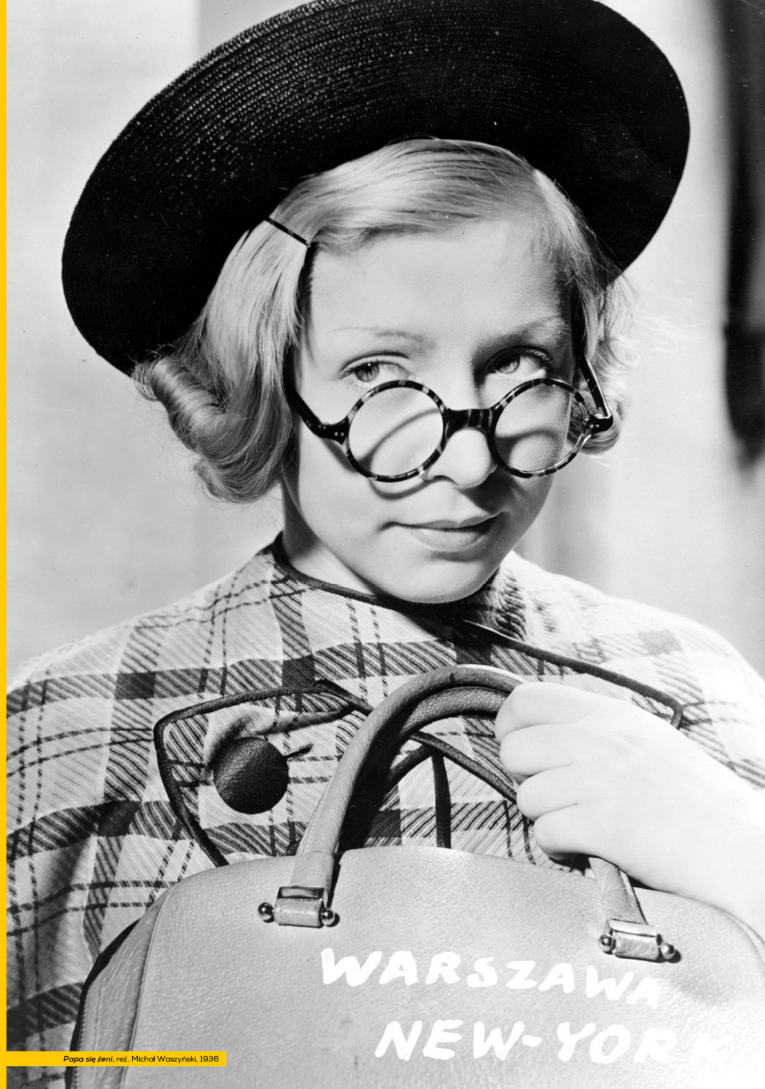
Papa się żeni, reż. Michał Waszyński, 1936